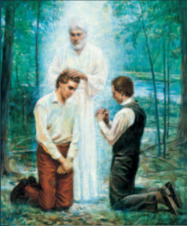
Joseph Smith ve Oliver Cowdery, 15 Mayıs 1829 tarihinde Vaftizci Yuhanna'nın ellerini başlarının üzerine koyması suretiyle Harun Rahipliği'ni aldılar.

Bir sonraki ay (Mayıs 1829), hâlâ tercümeye devam ediyorduk ve bir gün dua etmek ve levhaların tercümesinde belirtildiğini gördüğümüz üzere, günahların bağışlanması için vaftiz olunması ile ilgili Rab'be soru sormak üzere