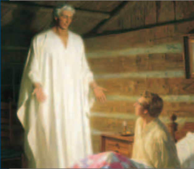
Joseph Smith'in İlk Görümü'nden üç yıl sonra Tanrı, İsa Mesih'in sevindirici haberinin iade edilmesiyle ilgili olarak Joseph'a talimat vermesi için, melek Moroni'yi gönderdi.

Joseph Tanrı'yı gördüğünü inkar etmeyi reddettiği sürece zulüm devam etti. 21 Eylül 1823 günü yatağına yattıktan sonra, Joseph Rab'bin huzurundaki yerini öğrenmek üzere dua etti. Melek Moroni ona göründü.