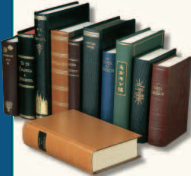
Mormon Kitabı, ilk olarak 1830’da basılmış olup, halihazırda dünya genelinde 80’den fazla dilde yayınlanmaktadır.

Joseph Smith’in hikayesi ile ilgili daha detaylı bir anlatım için, bkz. Çok Değerli İnci’de veya Kilise Tarihi’nde yer alan Joseph Smith – Tarihçe, 1:2–79.