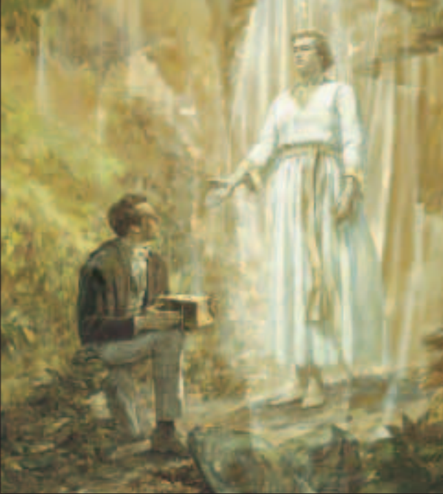
Moroni dört yıl boyunca, yılda bir defa gelip genç peygambere detaylı talimatlar verdi. Bu dört yıldan sonra, Joseph levhaları aldı ve Mormon Kitabı'nı tercüme etmeye başladı.

Hemen yataktan kalktım ve her zaman yaptığım gibi, günlük gerekli işlere başladım; fakat diğer zamanlarda olduğu gibi çalışmaya yeltendiğimde, gücümün hiçbir suretle çalışamayacağım kadar tükendiğini farkettim.