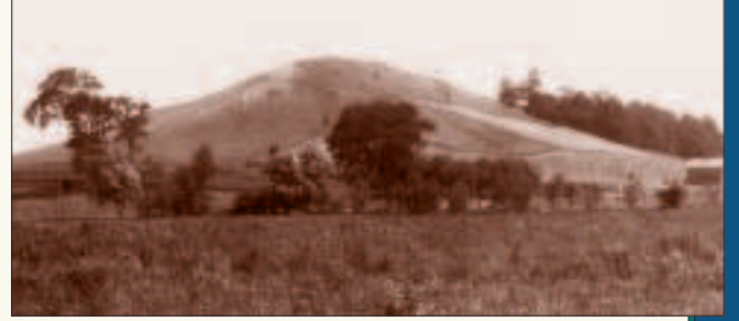
Kumoralı Dağı, New York Palmyra'daki Smith çiftliğinin yaklaşık olarak üç mil güneydoğusundaydı. Joseph'in zamanında, kuzey ucu çimenle, güney kesimi ise seyrek ağaçlarla ve ormanlarla kaplıydı. Levhalar batı kesiminde tepeye çok yakın bir yerde gömülüydü. Fotoğraf: Ağustos 1907

Bu sırada, benim zihnimde oluşan etkiler o kadar derindi ki, uykum kaçtı ve görüp duyduğum şeylerin hayretiyle şaşkına döndüm. Ancak, aynı elçi tekrar gelip yatağımın yanında durduğunda, daha önce anlattığı şeylerin aynısını uzun uzadıya anlattığını ya da tekrar ettiğini duyduğumda çok şaşırıldım. Bana ayrıca bir uyarıda da bulundu: Şeytan'ın bu levhaları