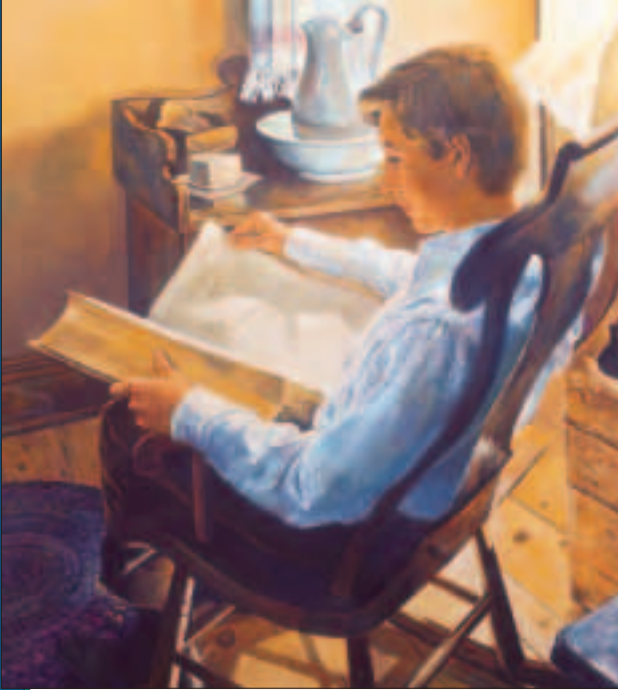
Joseph hangi kiliseye katılacağını düşünürken, Kutsal Kitabın rehberliğini araştırdı. Orada, «Tanrı'ya sor» sözlerini okudu.

O günden sonra Joseph, son zamanlarda, İsa Mesih'in Son Zaman Azizler Kilisesi'ni oluşturmak ve yeryüzünde Tanrı'nın krallığını inşa etmek üzere çalışarak Tanrı'nın hizmetinde yer aldı. Kilise'nin imanlı üyeleri, İsa Mesih'in dünyanın Kurtarıcısı ve Fidyeye ile Kurtaran olduğuna şahitlik etmektedirler. Bugün Tanrı, yeryüzündeki bir peygambere gönderdiği vahiyler yoluyla Kilise'yi yönetmektedir. Joseph Smith böyle bir peygamberdi. Joseph hayatı boyunca birçok şeyi