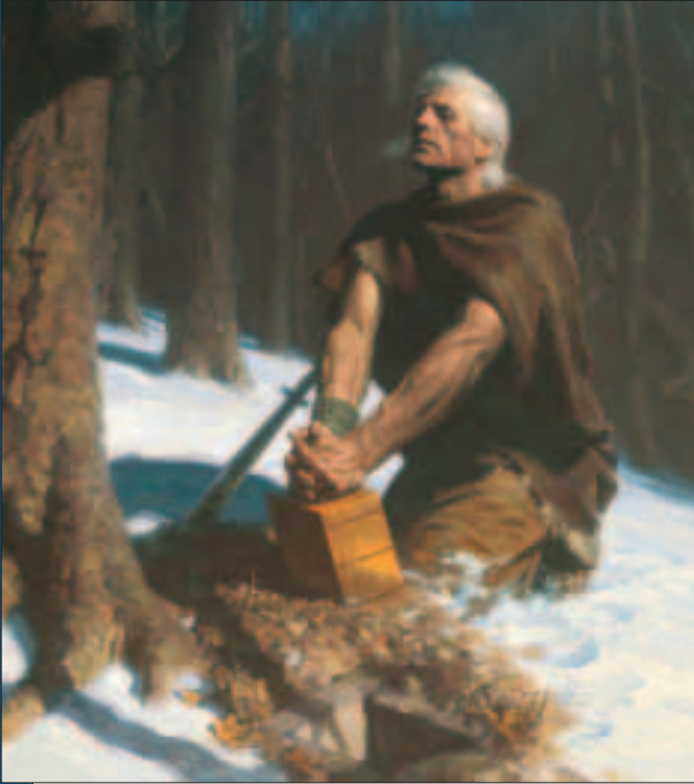
M. S. 421 yılında, peygamber Moroni kendi halkının mukaddes kayıtlarını Kumorah Dağı'na gömdü. Daha sonra, dirilmiş bir kişi olarak geri döndüğünde, Joseph Smith'e Kurtarıcı'nın Amerika kıtasının eski sahiplerine bıraktığı şekliyle sevindirici haberin tamamını içeren eski kayıttan bahsetti. O kayıt, Mormon Kitabı'dır.

Bunun yanısıra, levhalarla birlikte gümüş çerçeveler içinde iki taşın da saklı olduğunu söyledi. Bir göğüs zırhına bağlanmış olan bu taşlar, Urim ile Tumim'i teşkil etmekteydi. Bu taşların mülkiyetinin ve kullanımının antik veya eski çağlardaki 'görenlerin' ne olduğunu anlattığını söyledi. Ve Tanrı onları kitabın tercüme edilmesi amacıyla hazırlamıştı.